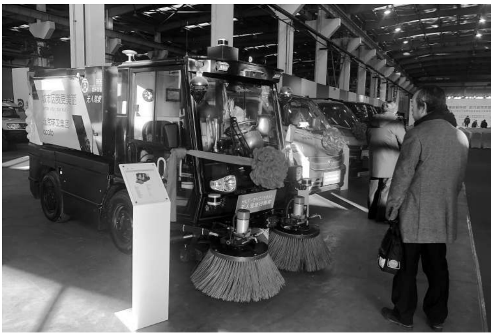
一辆小型纯电动扫路车作业效率约相当于20名环卫工人。